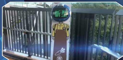
豊洲市場でも採用されました