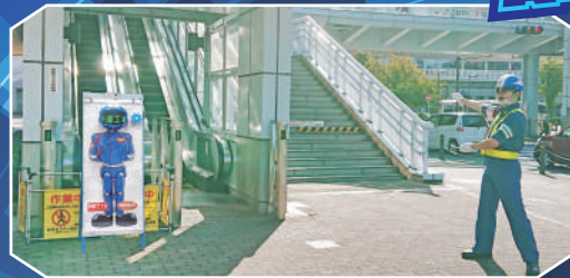
エスカレータ迂回案内に

折警は年間2万4,603枚稼働。 総額約2億4千万円削減！ 様々なシーンで活躍中！