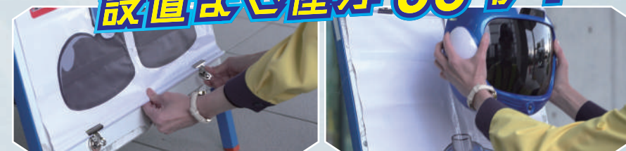
既存の立て看板に磁石で付けるだけ