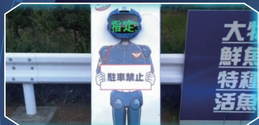
駐車禁止の広報に