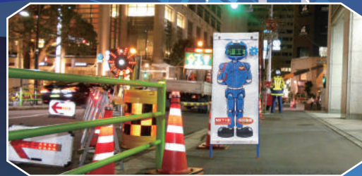
夜間の歩行者案内に