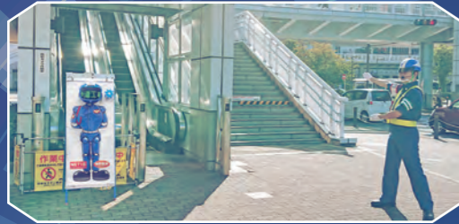
エスカレーター迂回案内