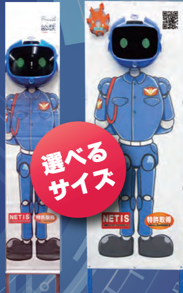
スリム看板も選べます