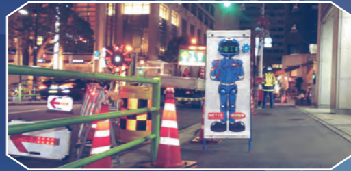
夜間の歩行者案内