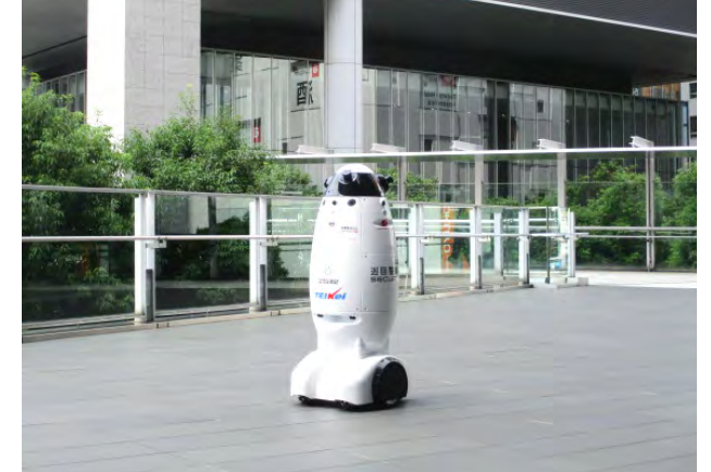
当社既存現場実走風景

防塵・防水使用 (IP53相当) となっており、施設の外構部における走行が可能 (雨天時は屋根直下まで対応)。