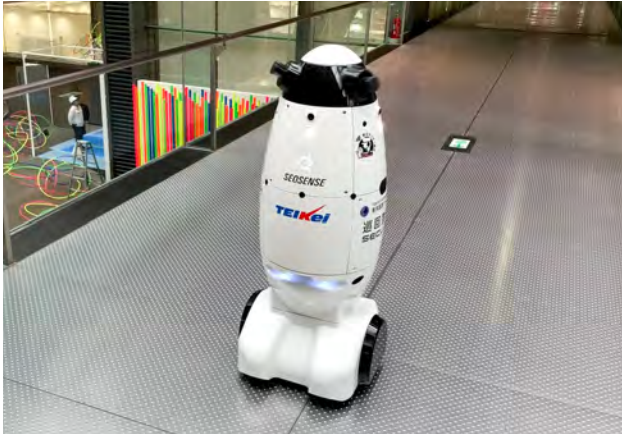
当社既存現場実走風景

警備ロボットは高度な経路計算による優れた自律移動性を有し、混雑下においても安全・迅速な移動を実現。